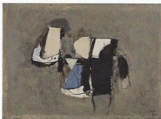
Afro Basaldella, Sans titre , 1973, technique mixte sur papier marouflé sur toile, 48 x 66 cm (GALERIE JEAN-FRANÇOIS CAZEAU, PARIS).

« AFRO BASALDELLA, ŒUVRES 1947-1975 », galerie Jean-François Cazeau, 8, rue Sainte-Anastase, 75003 Paris, 01 48 04 06 92, du 26 avril au 31 juillet. + d'infos : http://bit.ly/7171basaldella