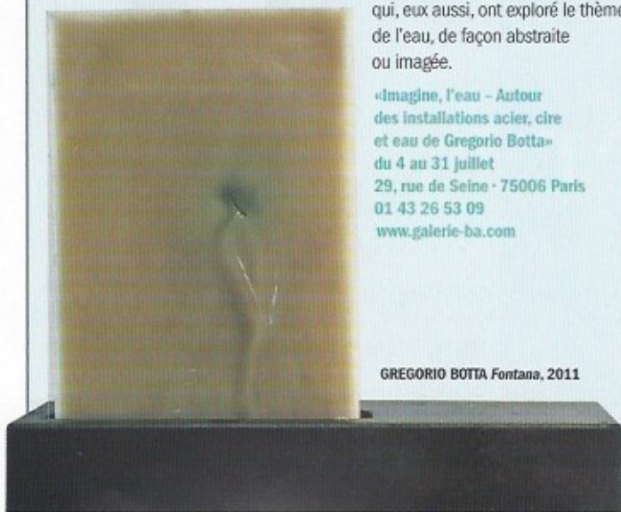
GREGORIO BOTTA Fontana, 2011

«Imagine, l'eau - Autour des installations acier, cire et eau de Gregorio Botta» du 4 au 31 juillet 29, rue de Seine · 75006 Paris 01 43 26 53 09 www.galerie-ba.com