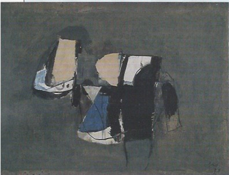
AFRO A 13, 1973

«Afro (Afro Basaldella) - Œuvres (1947-1975)» jusqu'au 20 juillet 8, rue Sainte-Anastase · 75003 Paris · 01 48 04 06 92 · www.galeriejfcazeau.com